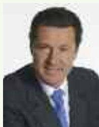
Christian Estrosi Ministre chargé de l'Industrie Maire de Nice Président de Nice Côte d'Azur

Pour relever ensemble les défis du changement climatique et du développement durable et pour faire de Nice, la ville verte de la Méditerranée, nous devons changer nos comportements et adopter une véritable démarche éco-citoyenne.