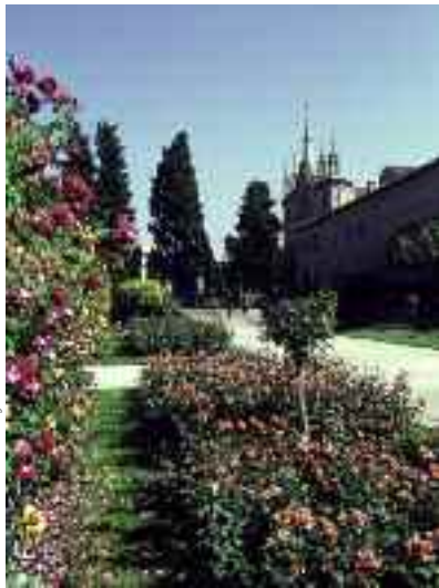
La roseraie du Monastère de Cimiez

Vous quittez le bord de mer pour vous diriger vers Cimiez . A proximité du Lycée Masséna, vous apercevez la rue Désiré Niel. C’est au numéro 8 de cette petite rue que Matisse prit possession en 1931 d’un ancien garage