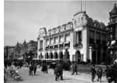
Le Palais de la Méditerranée, en 1935 et de nos jours

En 1918, l' Hôtel de la Méditerranée et de la Côte d'Azur , aujourd'hui disparu, est sa nouvelle résidence. Matisse y séjourna quatre ans et gardera longtemps le souvenir de ce lieu qui l'inspira tant. Retrouvant son luxe d'antan, le Palais de la Méditerranée , situé sur la Promenade des Anglais, renoue avec ses riches heures.