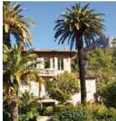
La Cité Historique de Vence