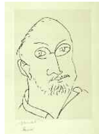
« Autoportrait - Grand Masque », 1944 lithographie sur papier Annam appliqué, support papier vélin d'Arches 53.9 x 37.9 cm - Musée Matisse, Nice

Importantes expositions à Nice et à Paris.