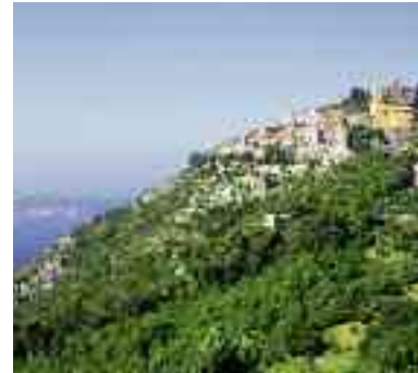
Eze-Village, la Citadelle de Villefranche-sur-Mer la Villa Kérylos à Beaulieu