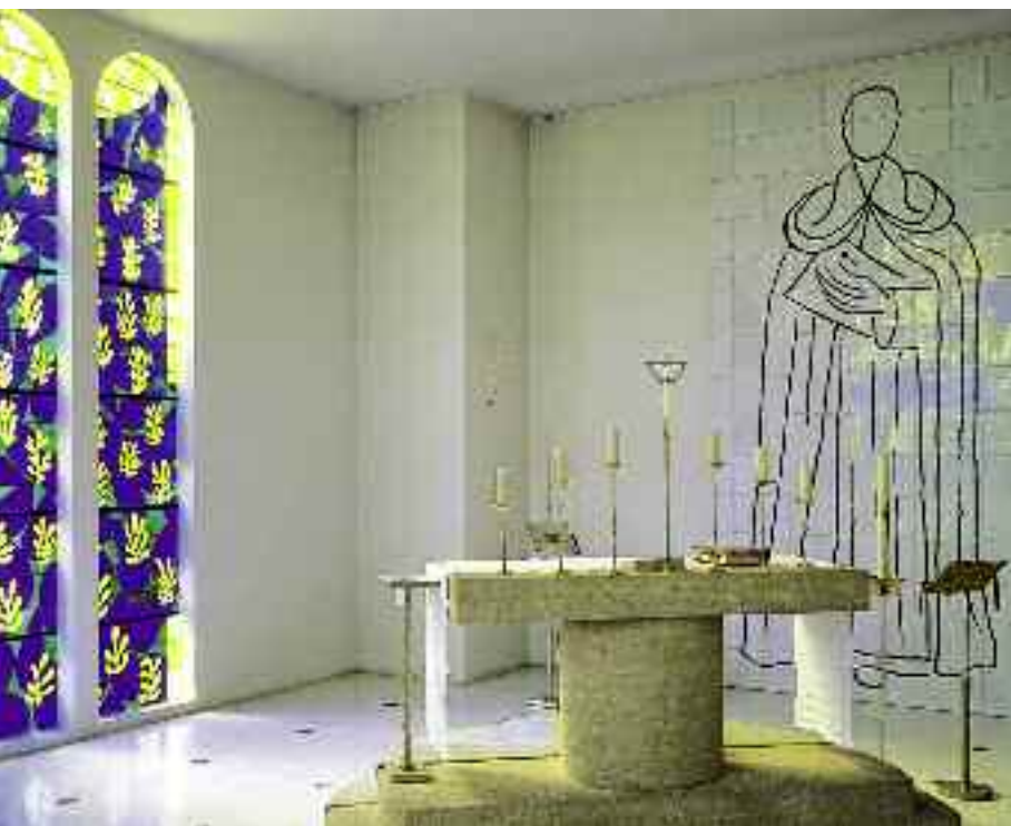
Photographie H. Del Olmo - © Succession Henri Matisse

Une fois à l'intérieur, la beauté des volumes définis par Matisse, ce blanc uni, simple et pur qui habille sol, murs et plafonds vous fascinent. Un jaune citron