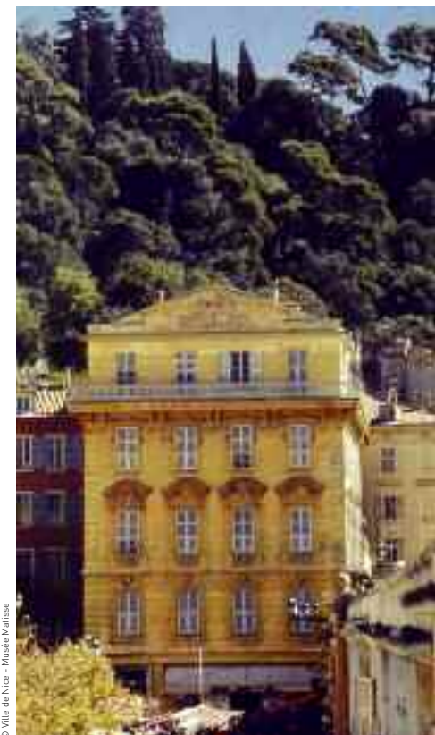
Immeuble du 1, place Charles-Félix, où vécut Matisse

Vous êtes face à la mer et juste derrière vous, le Cours Saleya , animé et coloré, vous attire irrésistiblement. A son extrémité, sur la place Charles-Félix , vous apercevez un bel immeuble. Matisse y vécut, une première fois au troisième étage, une seconde fois au quatrième étage dans un appartement plus vaste dominant toute la Baie des Anges.