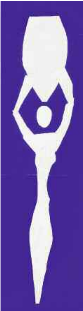
Photo C/MACMIHAM Dir. RNN/Philippe Migret - © Succession P. Matisse