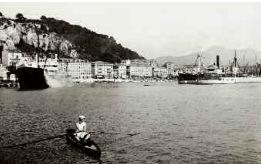
Matisse ramant dans le port de Nice

ce point de vue exceptionnel que vous découvrirez le port de Nice , bassin magnifique aux proportions sages, encadré de façades à l’italienne. Au 50 du boulevard Franck Pilatte, le dynamique Club Nautique de Nice se souvient. En 1927, un nouveau membre vient s’y inscrire. Son nom ? Henri