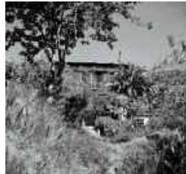
La Villa Le Rêve en 1943 et de nos jours

Le promeneur admire les remparts préservés et les cinq portes qui servaient d'accès, des lacis de ruelles, des maisons qui ont résisté au temps, des places et des fontaines, et quelques inscriptions romaines.