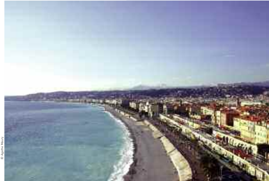
Nice et la Baie des Anges