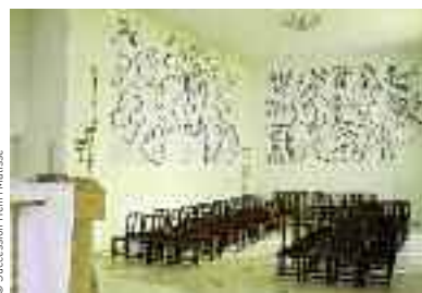
Photographie Ville de Nice - Musée Matisse © Succession Henri Matisse