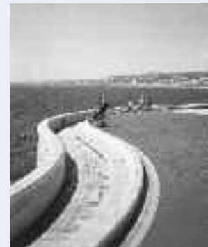
Raubu Capeu, Nice

Trait d’union entre le quai des Ponchettes et le port, cette avancée sur la mer possède une architecture résolument contemporaine récompensée par un grand prix d’urbanisme. Il offre au promeneur des angles de vue inouis.