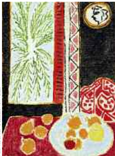
« Nature morte aux grenades », 1947 - huile sur toile, 80.5 x 60 cm - Musée Matisse, Nice

En 1943, Matisse loue la Villa Le Rêve à Vence pour s'éloigner un temps de Nice menacée par les bombardements. Il projette d'y demeurer seulement quelques semaines, mais touché par la