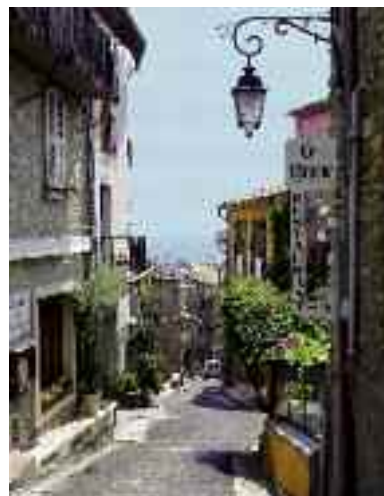
Ruelle du Haut-de-Cagnes

Oliviers, jardin de Renoir à Cagnes, 1917 - Paysage de Cagnes avant l'orage, vers 1918 - L'automne à Cagnes, 1918 - Maison entre les arbres, 1919.