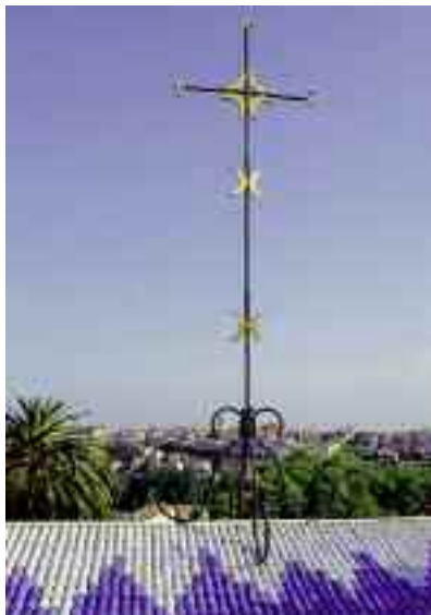
photographie H. Del Olmo - © Succession Henri Matisse