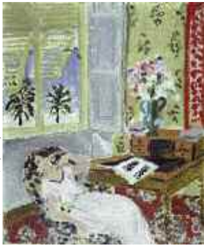
« Intérieur à Nice – la sieste », 1922 huile sur toile, 66 x 54.5 cm Mnam / Cci, Centre G. Pompidou, Paris

Vous êtes aux portes de Nice, et déjà sur la Promenade des Anglais . L'image est saisissante, échanges de bleus enchanteurs, soleil tendre, la Méditerranée accompagne vos pas sur plusieurs kilomètres... Vous découvrez cette magie azurienne comme le fit Matisse.