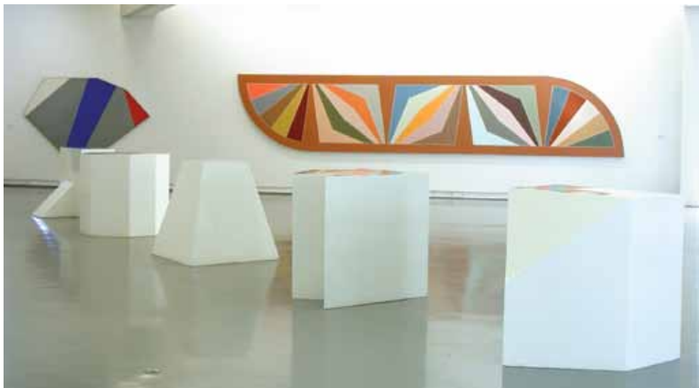
Vue des collections permanentes du musée - Salle Abstraction américaine