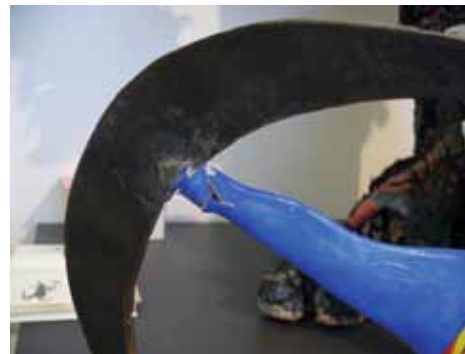
1- Le vase Sagittarius après restauration