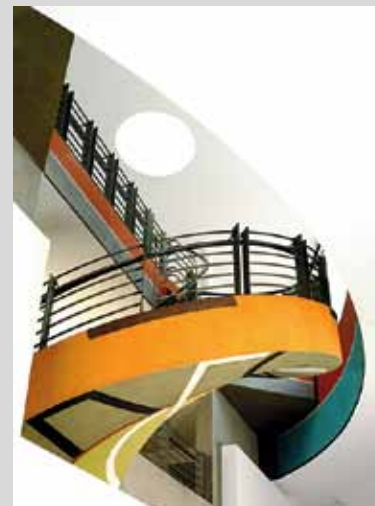
David Tremlett, Drawing for S. , 2005 - Peinture murale, pastel, pigments purs et mine de plomb - Coll. Mamac, Nice - © Mamac, Nice / David Tremlett

Eve Epivent 04 93 62 55 31 lesamisduamamac@yahoo.fr