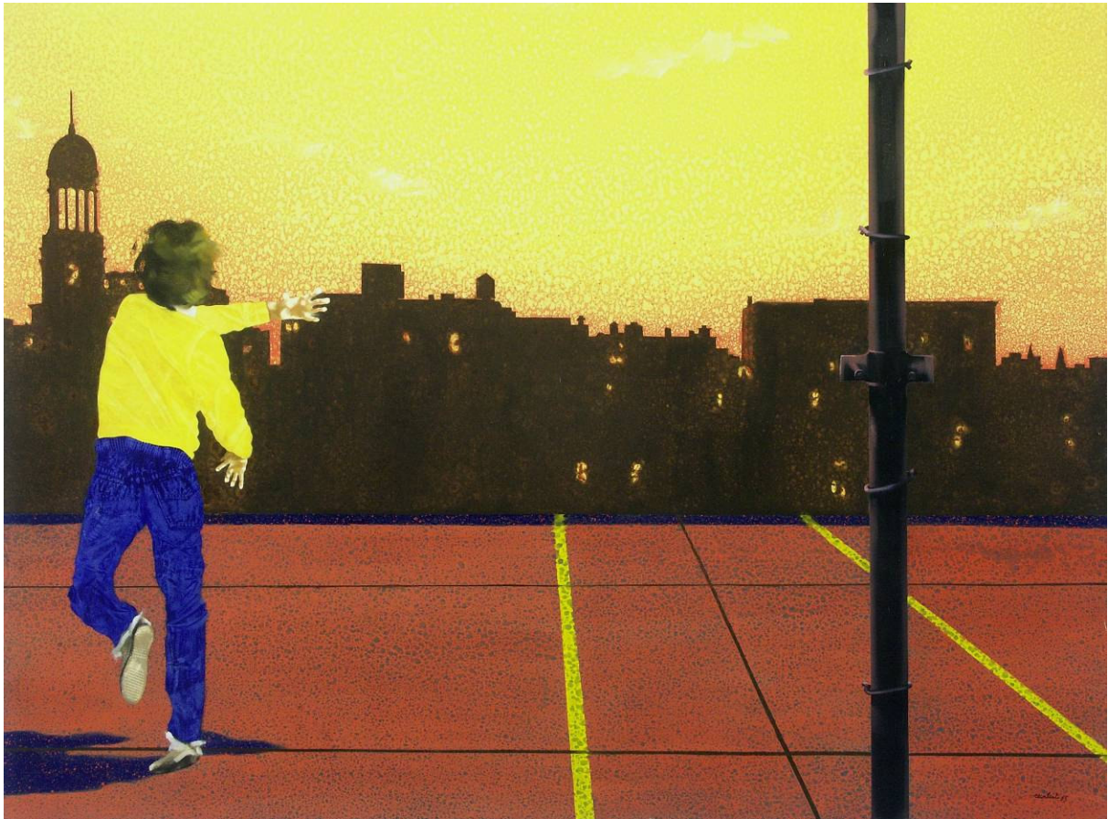
Antonio Recalcati - Sans titre , 1983 Huile sur toile de lin - 140 x 220 cm Collection Mamac, Nice, inv.2005.5.1., achat avec l'aide du FRAM

Vernissage le jeudi 3 novembre à 18 heures 30