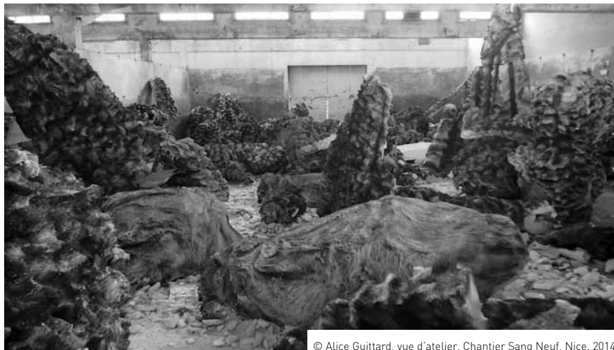
© Alice Guittard, vue d’atelier, Chantier Sang Neuf, Nice, 2014

Sur place, une gigantesque installation parcourt, en forme de labyrinthe, occupe l’intégralité des lieux. Grotte