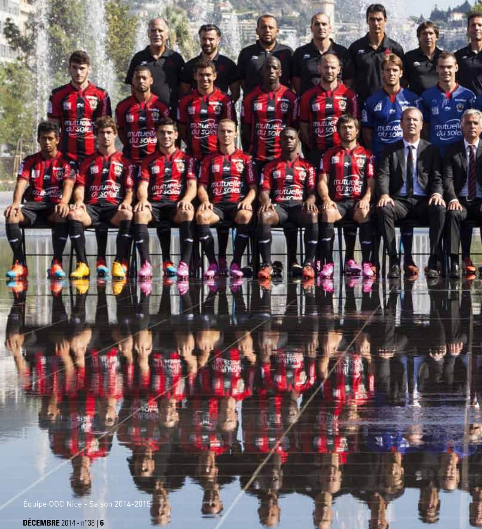
Équipe OGC Nice - Saison 2014-2015