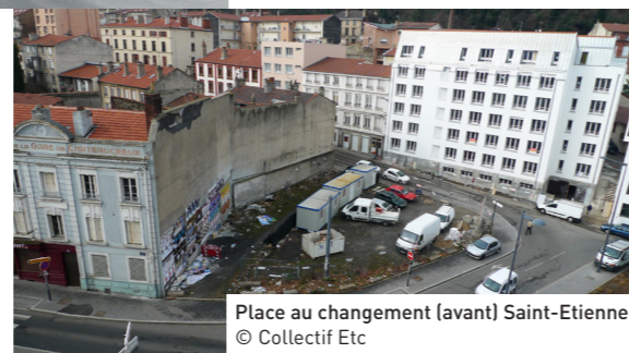
Place au changement (avant) Saint-Etienne © Collectif Etc