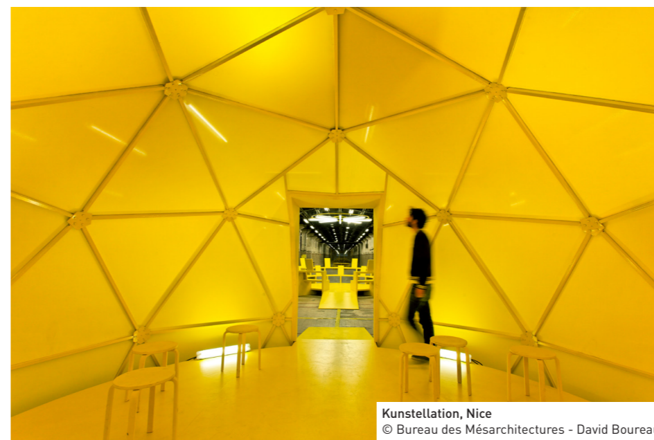
Kunststallation, Nice © Bureau des Mésarchitectures - David Boureau