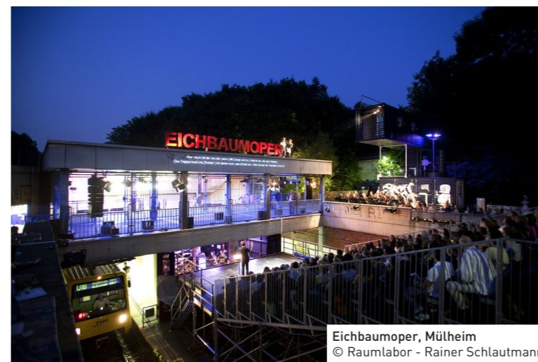
Eichbaumoper, Mülheim