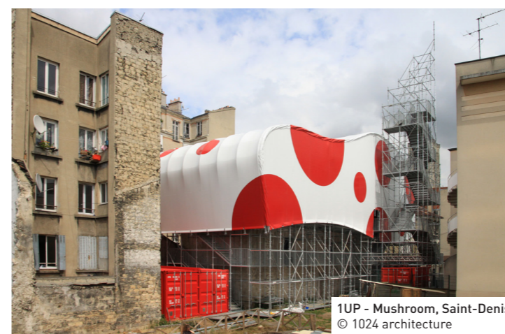
1UP - Mushroom, Saint-Denis © 1024 architecture