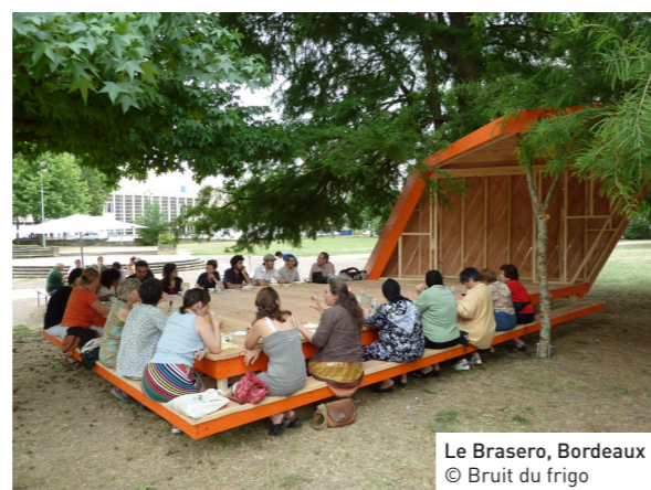
Le Brasero, Bordeaux