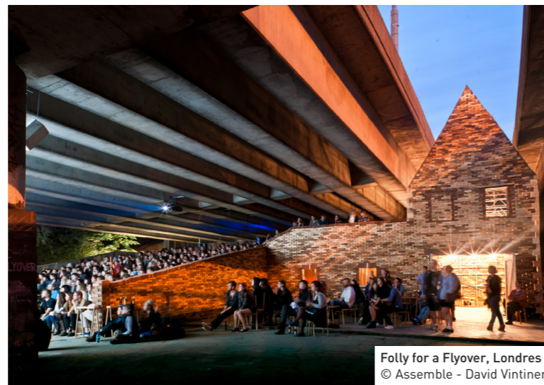
Folly for a Flyover, Londres © Assemble - David Vintiner

Directeur Général du Pavillon de l'Arsenal