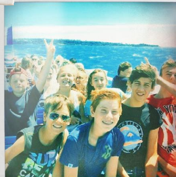
Les aventuriers de l'île Ste Marguerite

Renseignements sur WWW.CDMM.FR et inscriptions au 04 93 55 33 33