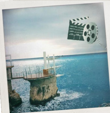
Touche pas à ma planète !