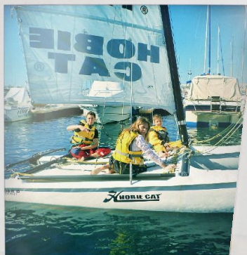
Voile, vent & compagnie

Un centre de loisirs qui se veut différent !