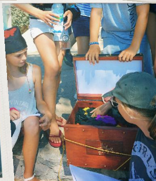
Cœurs de pirates