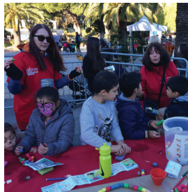
Mercredi 13 décembre, Fête de Noël du quartier des Moulins au Parc Phoenix.