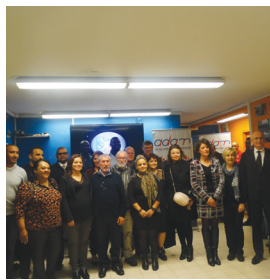
Officialisation du Conseil citoyen des Moulins.