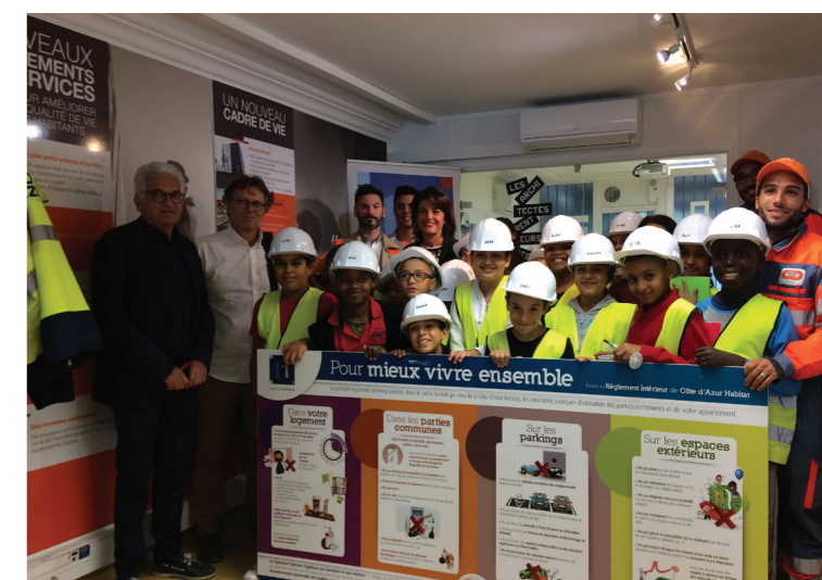
Présentation du règlement intérieur de Côte d'Azur Habitat.