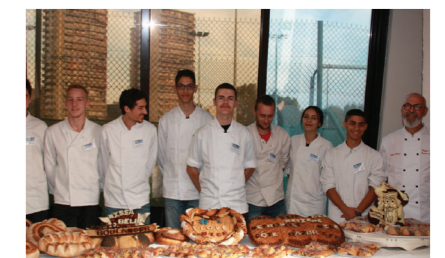
Équipe du CFA Métropolitain.