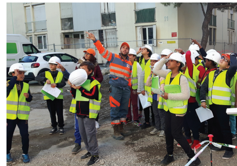
Visite de chantier pour une classe de CM2 de l'école de la Digue II.