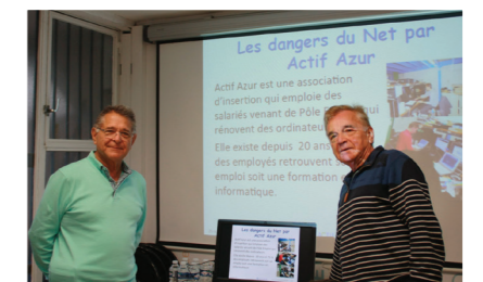
Atelier Actif Azur sur les dangers du net.