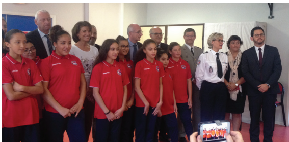
Vendredi 20 octobre : remise des tenues de la classe citoyenneté du collège Jules-Romains.