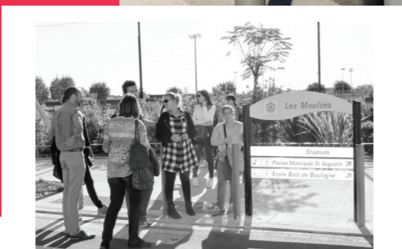
24 novembre. Test grandeur nature avec le SESSAD et l'association Trisomie 21.

Opération d'envergure, le projet de rénovation urbaine du quartier des Moulins méritait bien une exclusivité : une signalisation piétonne accessible à tous, notamment aux personnes souffrant de troubles cognitifs ou en situation de déficience intellectuelle, et spécialement conçue pour le quartier des Moulins. Explications.