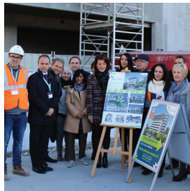
Jeudi 16 novembre : café chantier « Les Terrasses des Jacarandas ».