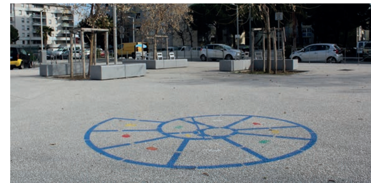
Jeu escargot, parvis de la piscine