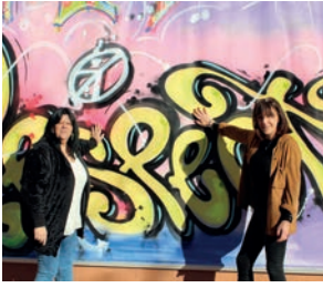
Street Art dans l'école de la Digue I.