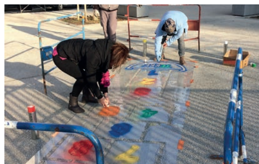
Marelle, parvis de la piscine