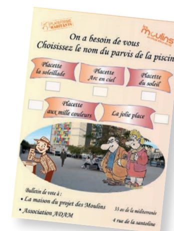
Bulletin de vote réalisé par la plateforme habitants

de blocs béton initialement prévus. Ces réajustements ont été le fruit du travail de la plateforme habitants qui a été sollicitée pour donner son avis et faire des propositions, en lien avec la Maison du projet. Cette démarche sera certainement renouvelée pour l'aménagement du jardin des Jacarandas, au pied de la résidence Les Mosaïques, qui sera prochainement réalisé par la Ville de Nice pour poursuivre l'embellissement du quartier.