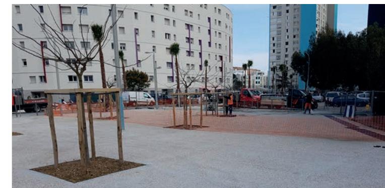
Placette face aux écoles de la Digue

VOUS SOUHAITEZ PARTICIPER À LA VIE DE VOTRE QUARTIER ? Rejoignez la plateforme habitants du quartier des Moulins