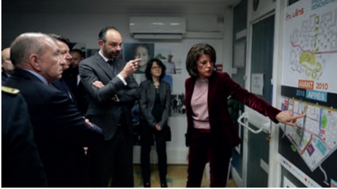
Vendredi 2 mars visite du Premier Ministre aux Moulins.