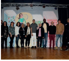
Spectacle La propreté pour les ZINS et les autres.