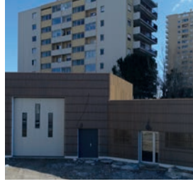
La future recyclerie.