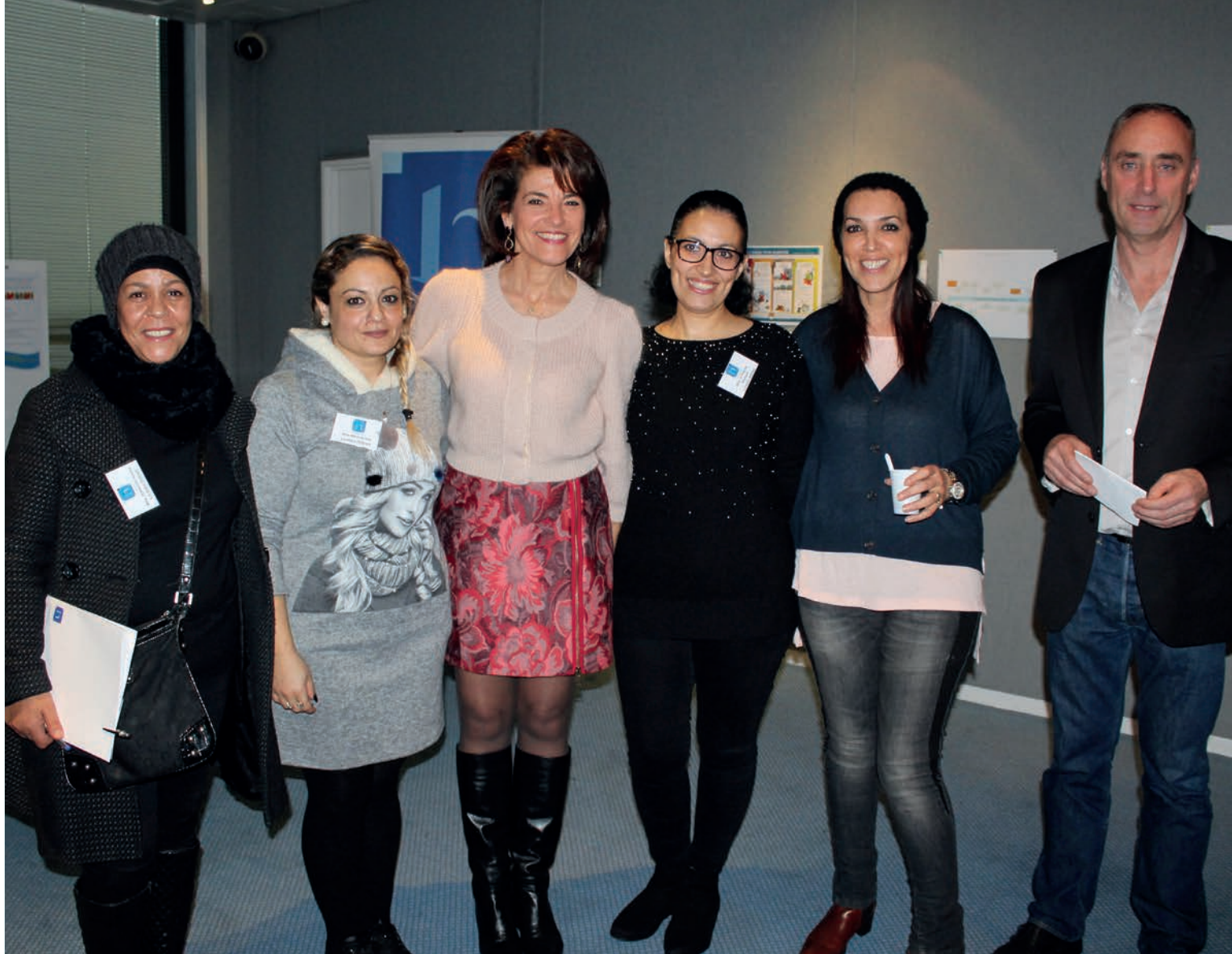
Signature de la charte «Référénts locataires» de Côte d'Azur Habitat