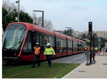
Essais du tramway sur le bd Paul-Montel.