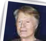
J.M.G. Le Clezio