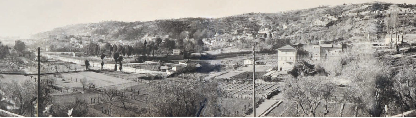
Panorama sur la campagne niçoise avant l'urbanisation du quartier, années 1950-1960.

à tonnelle et jeux de boules parsemaient les chemins desservant les exploitations. L'air était pur sur ce plateau ; les Niçois de la ville venaient y déjeuner les dimanches et les médecins conseillaient d'y faire promener les enfants atteints de coqueluche. Un habitat populaire de pavillons entourés de jardins s'implanta au cours des années 1930. Comme Le Ray et Gorbella en contrebas, Las Planas devenait peu à peu une banlieue résidentielle de Nice abritant, d'une part, des retraités, rentiers, petits propriétaires et, de l'autre, les ouvriers agricoles et la main d'œuvre travaillant en ville.