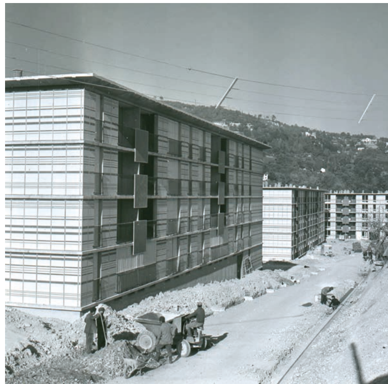
Groupes « Comte de Falicon » et « Rouret » en construction, février 1962 (Archives municipales de Nice, fonds du service photographique - Service des Archives Nice Côte d'Azur).

Parallèlement, la Ville construit les équipements collectifs nécessaires : un complexe sportif scolaire est édifié en 1966 et le collège inauguré en 1970 - il prendra le nom d'Henri-Fabre en 1973. À la rentrée 1987, s'ouvre une classe expérimentale de maternelle à l'école Las Planas pour les enfants intellectuellement précoces (EIP) et à la rentrée 1989, les enfants malvoyants et malentendants peuvent réussir leur intégration dans le système scolaire « normal » au collège Henri-Fabre.