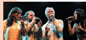
Groupe Corou de Berra

A capella est un spectacle de chants polyphoniques des Alpes du Sud, présenté par le groupe Corou de Berra. Leur répertoire, en perpétuelle évolution, va du chant traditionnel des Alpes de Méditerranée dans sa plus pure expression jusqu'aux créations contemporaines les plus inattendues. Musique jamais figée, interprétée avec toute la vivacité requise, par des chanteurs en pleine possession de leur culture et de leur art.