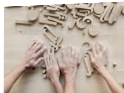
Jeux de mots