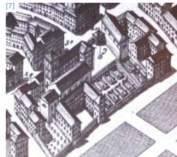
[3] Plan dit de Pastorelli, par Giovanni Ludovico Balduino, détail, 1610 / ADAM 01 0070