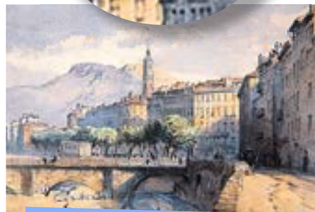
[12] Le Pont-Vieux, aquarelle de James Charles Harris, 1861, in Le Pays de Nice et ses peintres , 1998, Acadèmia Nissarda