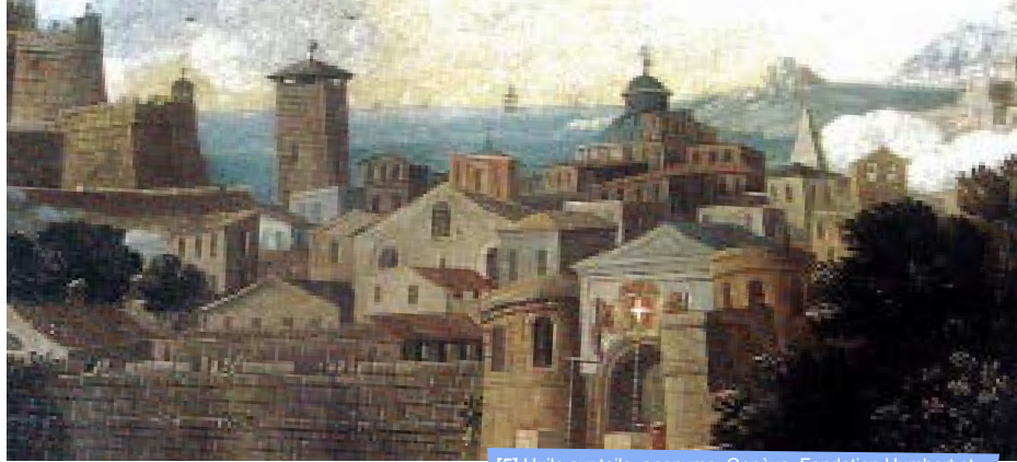
[5] Huile sur toile, anonyme, Genève, Fondation Humbert et Marie-José de Savoie, Palais Lascaris, 1998