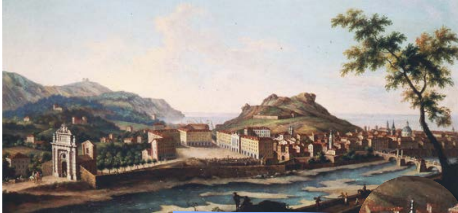
[8] Vue d'ensemble et détail d'une vue cavalière de Nice, huile sur toile de Vittorio Amedeo Cignaroli, Fondation Humbert et Marie-José de Savoie