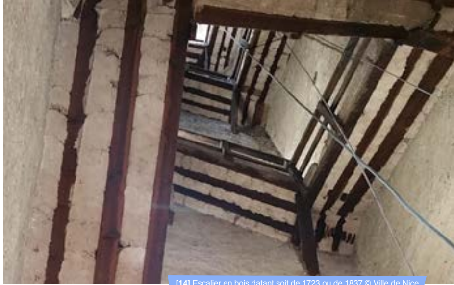
[14] Escalier en bois datant soit de 1723 ou de 1837