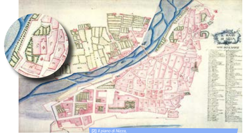
[2] Il piano di Nizza , plan général et détail du plan général. Lozières d'Astier, 1700 / SHAT 1VH1271