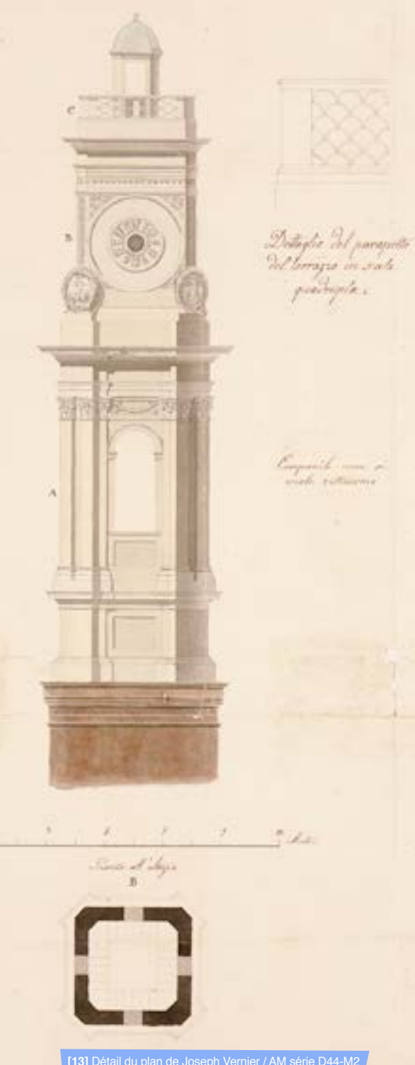
[13] Détail du plan de Joseph Vernier / AM série D44-M2