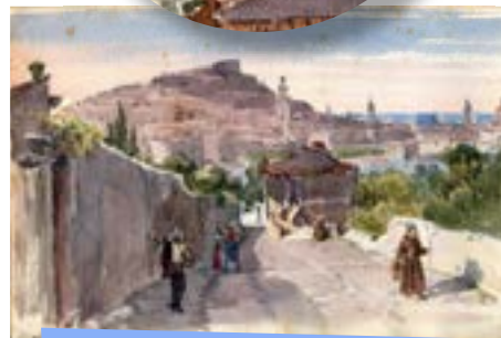
[11] Nice, vue prise de la montée de Cimiez, aquarelle sur papier d'Urbain Garin de Cocconato, vers 1837 / Bib Cessole