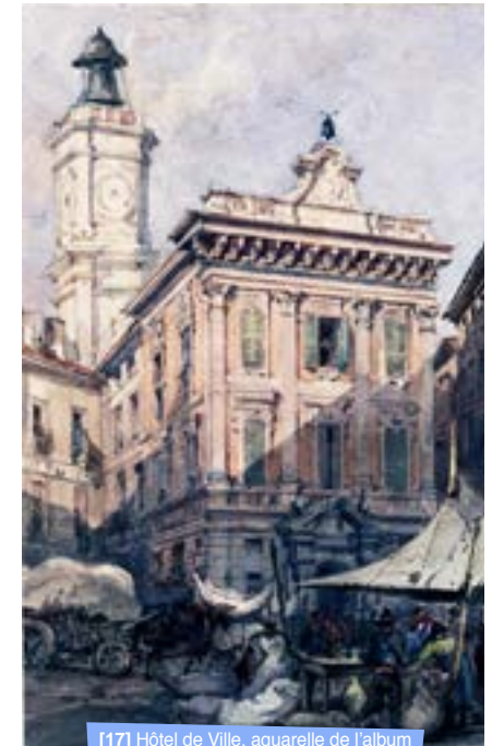
[17] Hôtel de Ville, aquarelle de l'album de Jacques Guiaud, vers 1855

Par le passé, la tour Saint-François fut un édifice majeur d'où partaient les manifestations organisées lors de l'anniversaire de l'Annexion à la France (1860). Hier, par son office d'horloge municipale, elle rythmait la vie des habitants du Vieux-Nice et affichait l'identité de la ville à son sommet en y faisant flotter son drapeau. Aujourd'hui, tout en perpétuant rythme et identité, la tour est devenue un élément visuel fort, notamment depuis que la Promenade du Paillon a ouvert une nouvelle perspective. Avec l'installation d'un escalier hélicoïdal, elle contribue à visualiser les sites d'un patrimoine hors du commun : les 400 000 ans de l'histoire de Nice se révèlent.