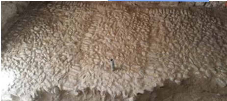
[15] Calade mise à jour en juillet 2019

Par le passé, la tour Saint-François fut un édifice majeur d'où partaient les manifestations organisées lors de l'anniversaire de l'Annexion à la France (1860). Hier, par son office d'horloge municipale, elle rythmait la vie des habitants du Vieux-Nice et affichait l'identité de la ville à son sommet en y faisant flotter son drapeau. Aujourd'hui, tout en perpétuant rythme et identité, la tour est devenue un élément visuel fort, notamment depuis que la Promenade du Paillon a ouvert une nouvelle perspective. Avec l'installation d'un escalier hélicoïdal, elle contribue à visualiser les sites d'un patrimoine hors du commun : les 400 000 ans de l'histoire de Nice se révèlent.