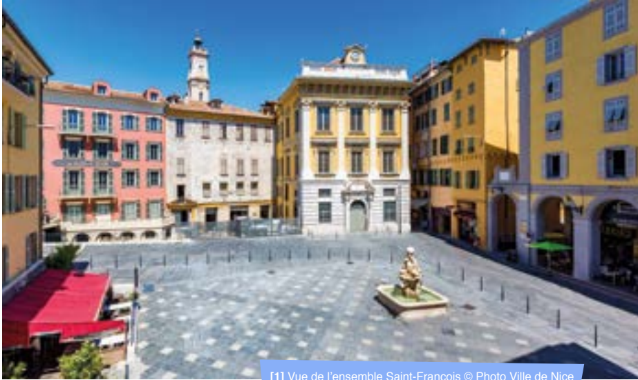
[1] Vue de l'ensemble Saint-François