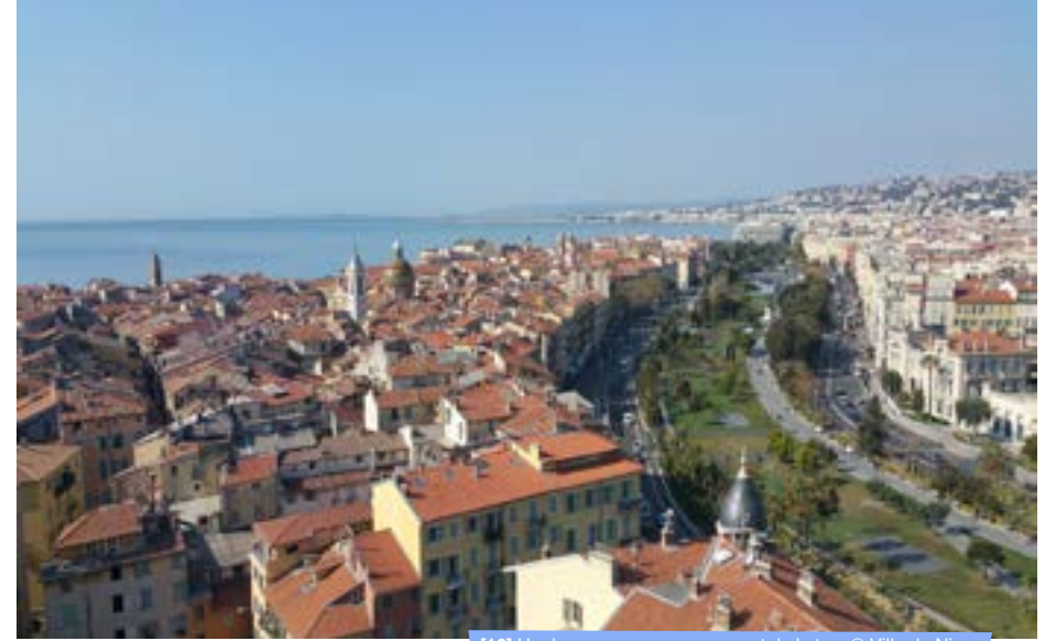
[16] Un des panoramas au sommet de la tour