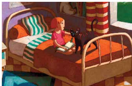
© DR Folimage, Centre du Cinema et de l'Audiovisuel de la Fédération Wallonie-Bruxelles