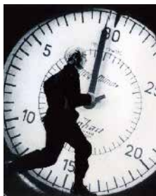
© DR Ateliers, Coproduction Office, Det Danske Filminstitut

JEUDI 6 FÉVRIER : 14H / MARDI 11 FÉVRIER : 16H