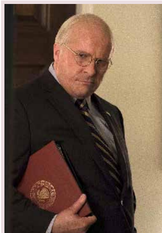
Vice © DR Annapurna Pictures, Gary Sanchez Productions, Plan B