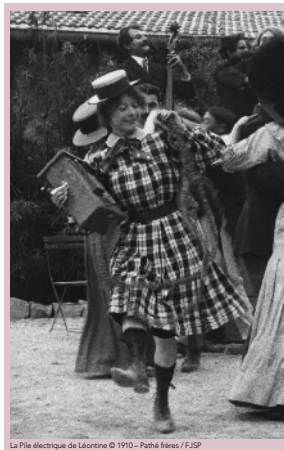
La Pile électrique de Léontine