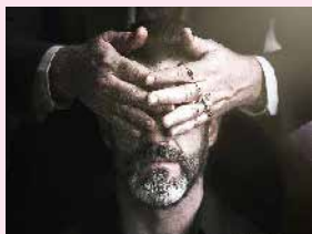
François Silvestre de Sacy © DR - Tu Vas Voir, La Casa de Production, Memento Films