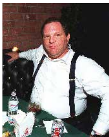
© DR Belvoir/Shutterstock / La Pace

JEUDI 13 FÉVRIER : 18H15 / VENDREDI 14 FÉVRIER : 20H