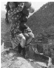
Léontine s'envole

MERCREDI 19 FÉVRIER : 20H / DIMANCHE 23 FÉVRIER : 17H