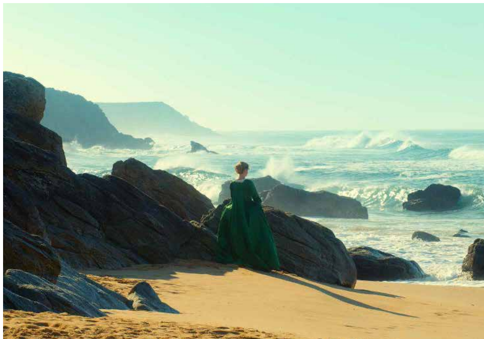
Portrait de la jeune fille en feu

Chaque mois, la Cinémathèque donne un second souffle à des films incontournables qui ont trop vite quitté l'affiche ou inédits à Nice. Ce mois-ci, coup de projecteur sur le documentaire L'Intouchable, Harvey Weinstein d'Ursula Macfarlane, une radiographie de l'ascension et de la chute spectaculaires du magnat d'Hollywood ; Vice d'Adam McKay qui revient sur le parcours politique hors norme du vice-président américain Dick Cheney ; Nevada , le premier long-métrage de Laure de Clermont-Tonnerre avec Matthias Schoenaerts ; Grâce à Dieu de François Ozon, récompensé par le Grand Prix du Jury au Festival de Berlin en 2019 ; ou encore Portrait de la jeune fille en feu de Céline Sciamma, un film d'amour en costume porté par Adèle Haenel, Prix du scénario au Festival de Cannes en 2019.