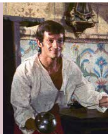
© DR StudioCanal, TFI DA, Video S.a.S (Italie)

JEUDI 13 FÉVRIER : 16H30 / MARDI 18 FÉVRIER : 18H